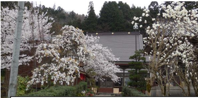
満開の境内風景 右はモクレン、左はソメイヨシノとしだれ桜