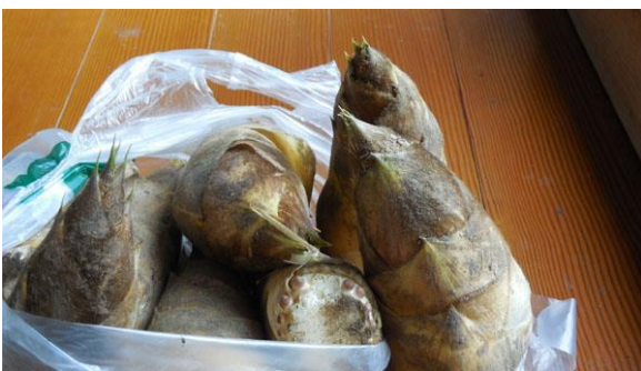
おときは、春の味覚タケノコを使って。