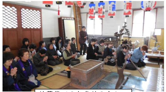
地蔵堂でのお参りの方々