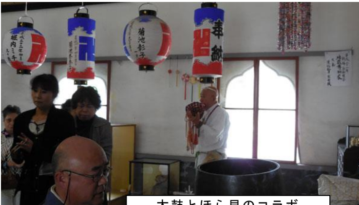
太鼓とほら貝のコラボ