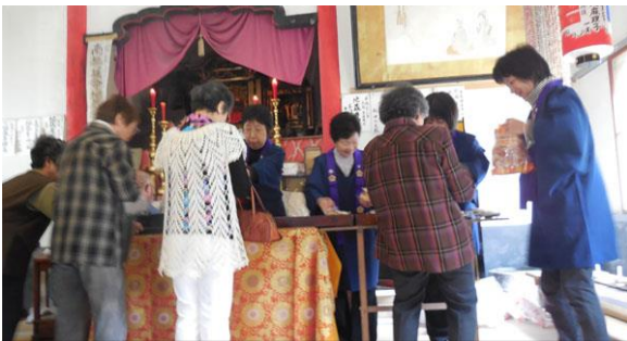
巡堂の様子 供物のお下がりをいただいています。